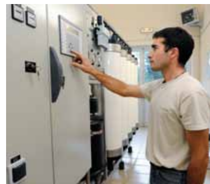
L. Billet - Saint-Amour (39)