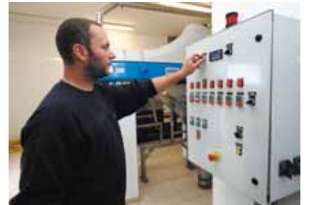
J. Auteserres - STEP de Meximieux (01)

SOGEDO propose aux collectivités et aux industriels, la réalisation des travaux électromécaniques sur les installations d'assainissement. Forte de ses moyens humains, de ses compétences techniques et d'une expérience reconnue par les collectivités dans le cadre de nombreuses délégations de service public, SOGEDO entretient, répare ou renouvelle tous types d'équipements électromécaniques dans le domaine de l'assainissement.