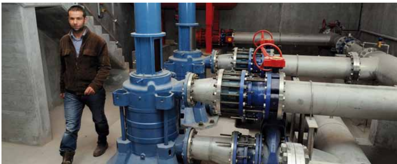
R. Martin - Station de pompage d'Oussiat (01)