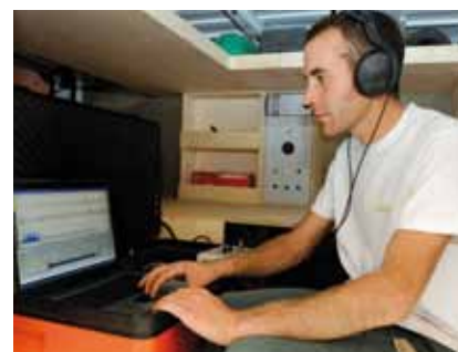
N. Jousot - Saint-Amour (39)