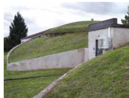
Réservoir à Meximieux (01)

Cette prestation est proposée aux collectivités, aux industriels, aux particuliers et plus largement à toute structure (centres de vacances, etc.) disposant de cuves dédiées à l'alimentation en eau potable.