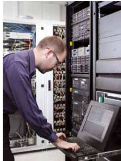
J. Griénay - Salle des serveurs (Lyon)