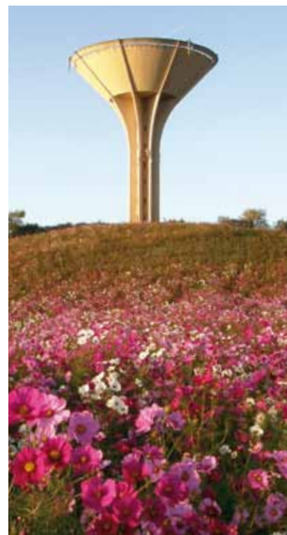
Château d'eau de Colombier-Saugnieu (69)